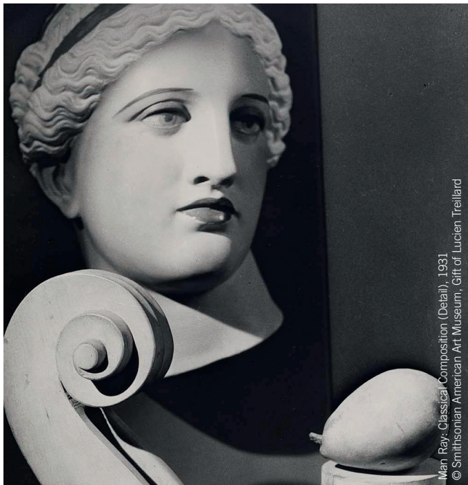
Mar Ray: Classical Composition (Detail), 1931

Die Klassischen Literaturwissenschaften, also Latinistik und Gräzistik, sind Teil der ältesten geisteswissenschaftlichen Einrichtung der Universität Heidelberg, des Seminars für Klassische Philologie. Die Klassische Philologie versteht sich als Brückenfach zwischen den geisteswissenschaftlichen Fakultäten. Sie lehrt und erforscht die griechische und lateinische Sprache und Literatur. Die Latinistik hat ihren Schwerpunkt in der klassischen Literatur der späten Republik und der frühen Kaiserzeit, in der Theorie der Literatur und der Philologie sowie in der Fortwirkung der antiken Literaturen in der modernen Welt. Im Mittelpunkt der gräzistischen Lehre und Forschung stehen die großen Gattungen der klassischen griechischen Literatur und ihre Rezeption in der Moderne. Einen besonderen Schwerpunkt bildet die Theorie der Geschichte. Als Bindefach zwischen den klassischen und modernen Literaturwissenschaften kann die Mittel- und Neulateinische Philologie gelten, die das komplexe Überlieferungsgeschehen in zahlreichen Facetten perspektiviert.