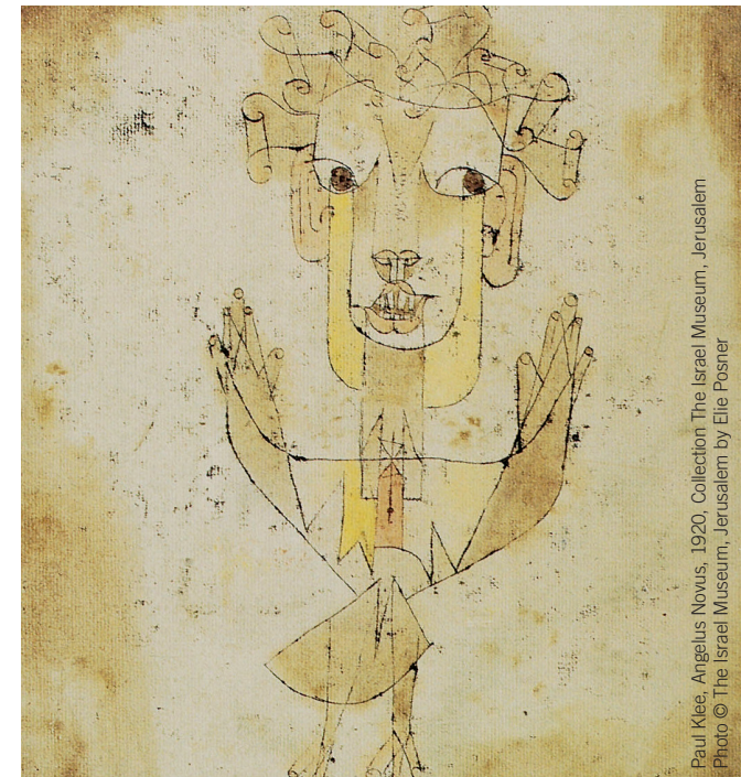
Paul Klee, Angelus Novus, 1920, Collection The Israel Museum, Jerusalem

Schwerpunkte in Lehre und Forschung sind u.a. Bibel und Jüdische Bibelauslegung; Talmud, Codices und Rabbinische Literatur; die Jüdische Philosophie und Geistesgeschichte; die Jüdischen Literaturen und die Hebräische Sprachwissenschaft.